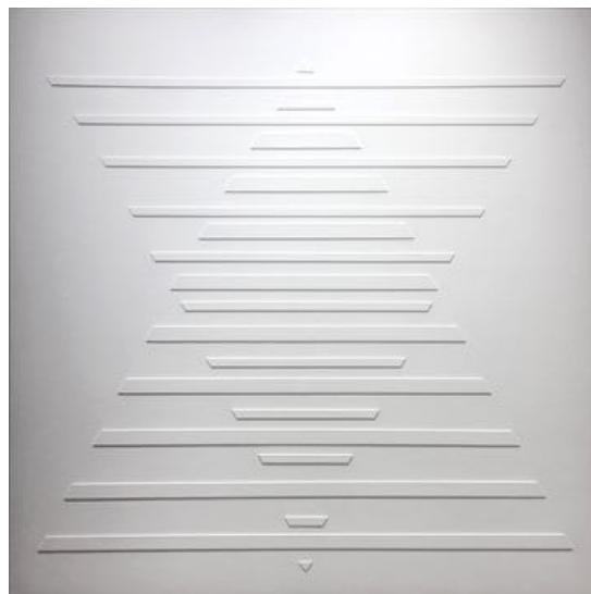
L'invisible a un espace / DC.03.03.2020

Il propose de nouvelles réalités à travers le jeu surprenant des reflets et des ombres silhouettées, l'intrigant dialogue des plans, l'imbrication des lignes et des figures en patchwork. Les espaces rendus surnaturels par la magie de la lumière nous interrogent sur l'effort à faire pour émerger de notre conditionnement.