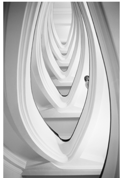
Scala XX septembre