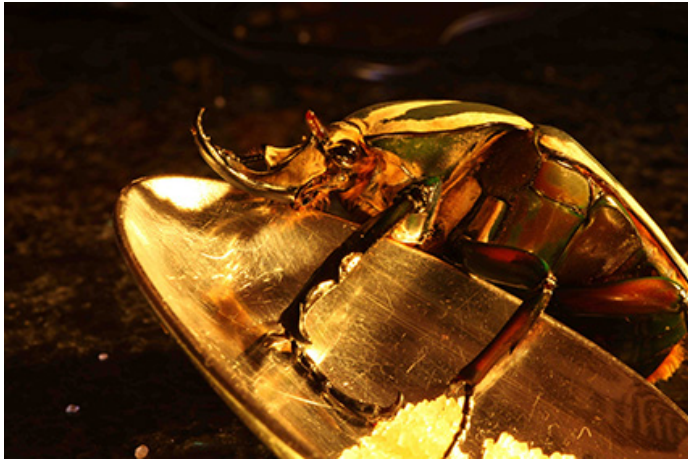
Sans titre, 2012, 5 exemplaires