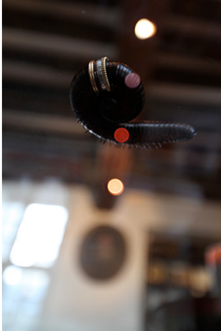
Sans titre , 2012, 5 exemplaires