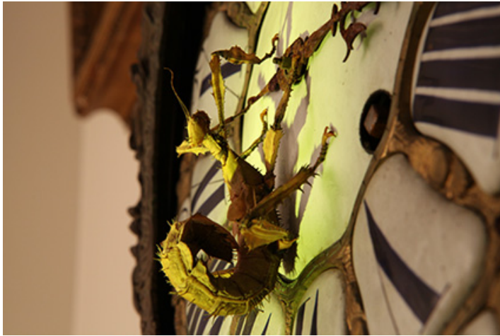
Sans titre, 2012, 5 exemplaires