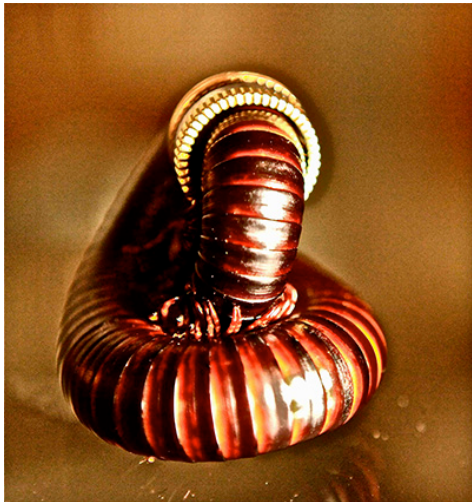
Sans titre , 2012, 5 exemplaires